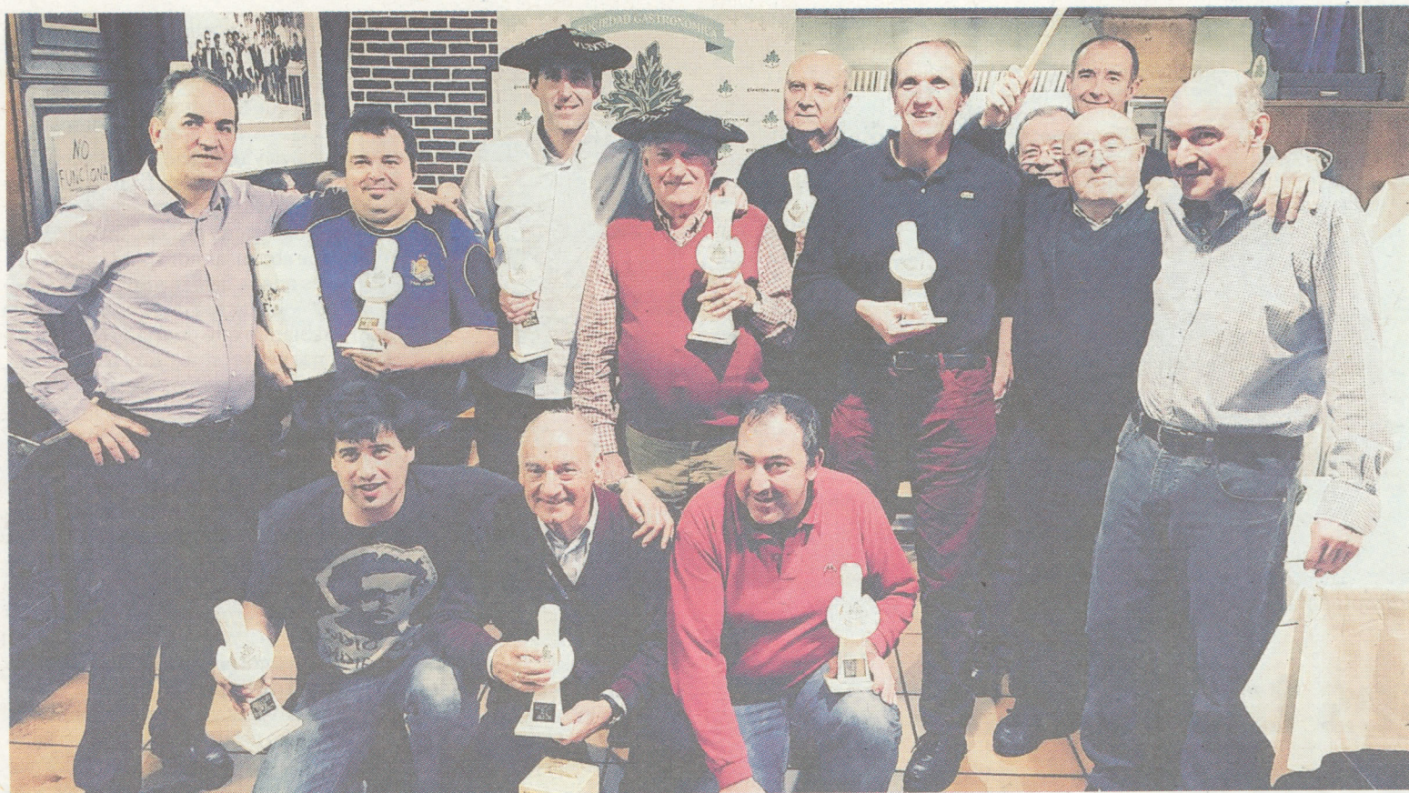
Los primeros clasificados, con sus trofeos, acompañados de responsables de la sociedad Gizartea.